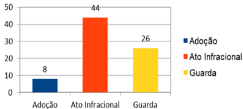
Gráfico 2 – Feitos Distribuídos na Vara da Infância e Juventude na Comarca de João Pinheiro 2020

Já no ano de 2020 foram 44 (quarenta e quatro) atos infracionais, 08 (oito) de adoção e vinte e seis (26) de guarda. Nota-se o declínio de infrações cometidas devido ao período de pandemia ocasionado pelo vírus do Covid-19.